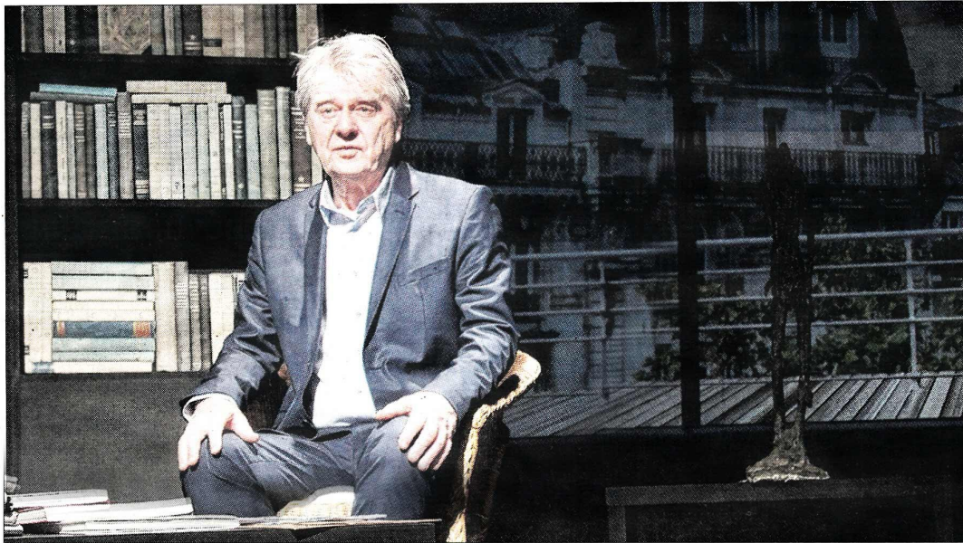
Pari réussi pour le comédien, accueilli par la Comédie de Picardie.